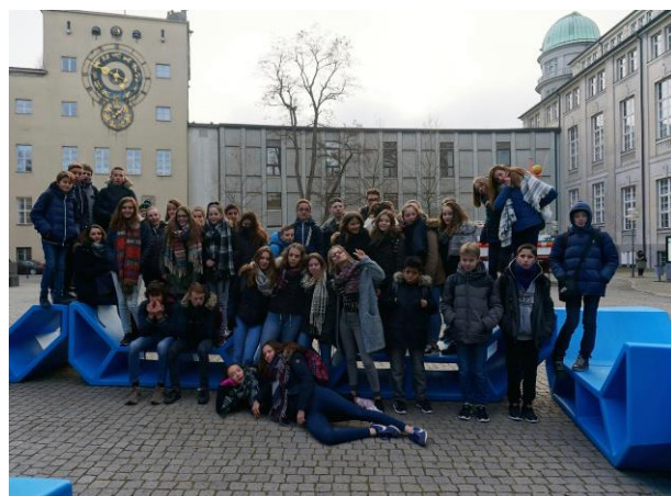
Les collégiens bressuirais à Munich en décembre 2016.

Quant aux élèves du collège Jules-Supervielle , ils étaient 39 à participer avec leurs professeurs au traditionnel voyage lors des marchés de Noël, en décembre dernier. Ils ont été reçus par le maire de Friedberg, Roland Eichmann, avant de rencontrer les collégiens de la Konradin Realschule .