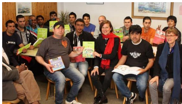
Un groupe de réfugiés en cours d'allemand à Mering

Au 1 er janvier, la ville de Friedberg comptait 29 892 habitants (contre 29 699 l'année précédente).