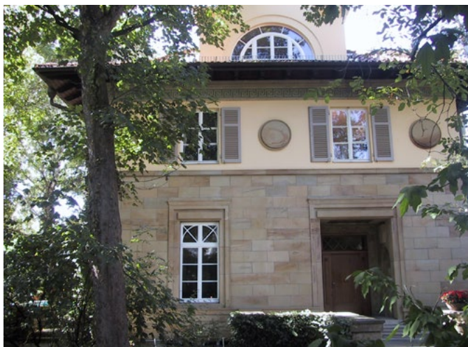
(1) L'Institut Franco-Allemand.