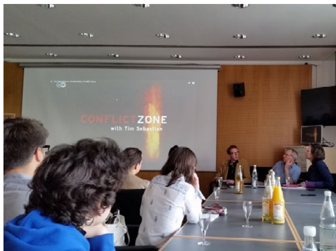
(6) Lors du séminaire média.

« Echanger – Unir l'Europe », c'était le titre de notre projet. Même si le titre semble ambitieux, il reflète bien la motivation de ces jeunes gens qui s'engagent en tant qu'auteurs, traducteurs ou rédacteurs pour nos magazines, qui font partie des activités des Jeunes Européens (Junge Europäische Föderalisten en Allemagne et Young European Federalists). Le séminaire a permis à des jeunes gens de rencontrer et d'échanger avec des bénévoles de plusieurs pays européens et d'améliorer la dynamique et les processus de travail au sein du magazine polyglotte.