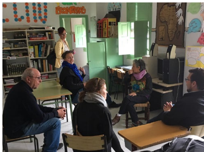
(4) Rencontre en Espagne.