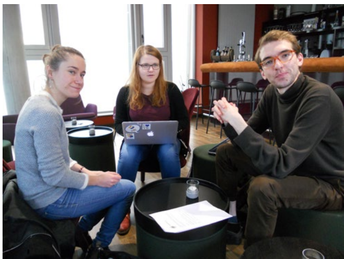
(5) Les représentants de l'équipe lors du séminaire On y va à Berlin.