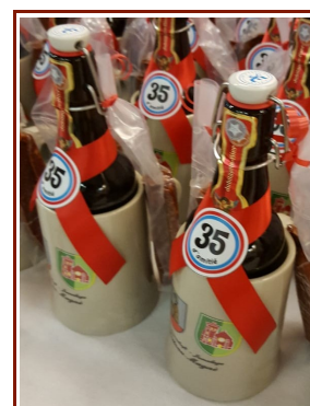
Un cadeau surprise des amis allemands offert à chacun des adhérents du comité de jumelage français.

Au delà des pérégrinations régionales, chacun retiendra la chaleur des échanges et la joie des retrouvailles en partageant le quotidien des familles d'accueil et les soirées tous ensemble.