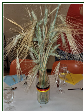
Des tables magnifiquement décorées par les bénévoles du comité de jumelage français

Malgré le temps pluvieux, le comité avait aussi prévu l'incontournable passage à la mer et pour certains dans la mer.