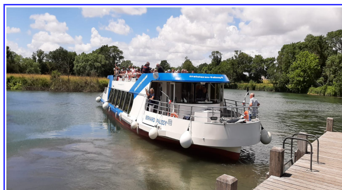
Une rencontre avec un producteur de pineau s'est poursuivie après le déjeuner au bord de l'eau, par une croisière sur la Charente